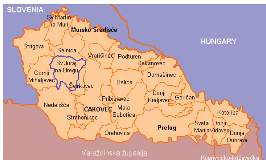
Slika 1: Položaj Općine Sveti Juraj na Bregu u Međimurskoj županiji

Općina Sveti Juraj na Bregu broji devet naselja; Brezje, Dragoslavec, Frkanovec, Lopatinec, Mali Mihaljevec, Okrugli vrh, Pleškovec, Vučetinec i Zasadbreg i zauzima površinu od 30,30 km 2 i graniči sa sedam susjednih JLS Međimurske županije (slika 1).