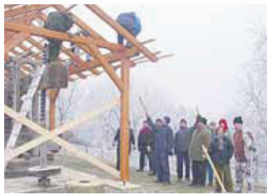
Evo kako se pokazuje zajedništvo Zasančara. Izgradnja etnokutka