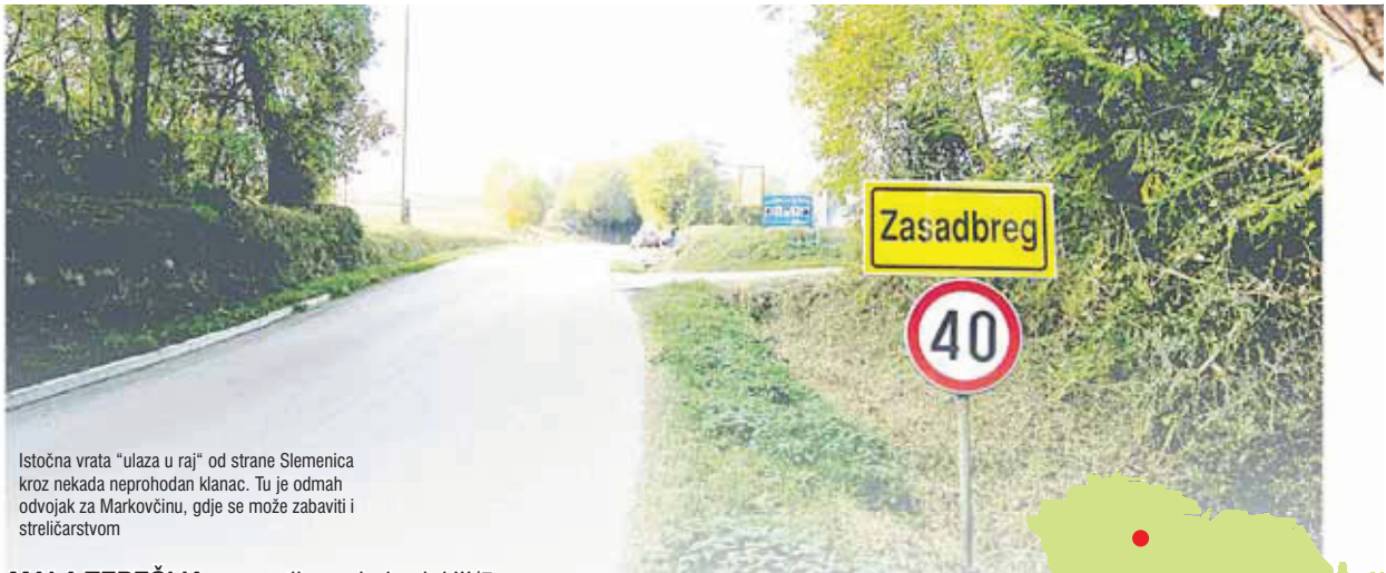
Istočna vrata "ulaza u raj" od strane Slemenica kroz nekada neprohodan klanac. Tu je odmah odvojak za Markovčinu, gdje se može zabaviti i streličarstvom