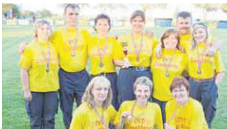
Ženska B-ekipa DVD-a Zasadbreg koju čine žene mjesnih čelnika