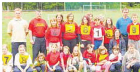
Mlade vatrogasne nade Zasadbrega