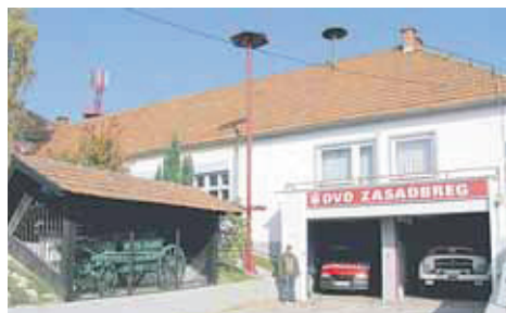
Vatrogasni dom s izloženom prvom špicrom koju su kupili u Dravskom Središću