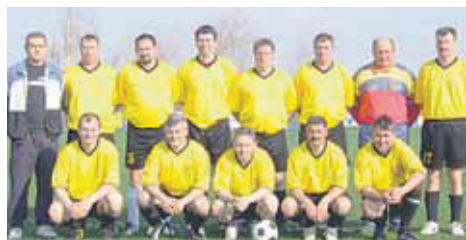
Veterani NK Zasadbreg

izi prom 40315 MURSKO SREDIŠĆE Frankopanska 8 Tel. ++385-40-543-392