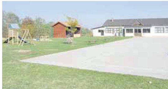
Dom kulture s etnokutkom u dvorištu