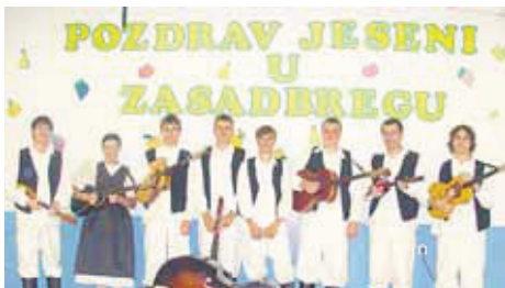
Tamburaši nakon jedne tradicionalne priredbe u selu "Pozdrav jeseni"