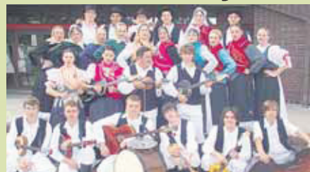
Zajednička fotografija članova KUU-a "Zasadbreg" poslije jednog nastupa

Zasadbreg pripada općini Sveti Juraj na Bregu i istoimenoj župi. Selo je udaljeno oko dva kilometra od državne ceste Mursko Središće - Čakovec, na prvim bregovima. Imaju sedam ulica ukupne dužine preko devet kilometara. Svaka ulica nosi svoj povijesni naziv, ili je dobila naziv po nekom od prvih stanovnika sela. Sve se te ulice spajaju u središnju ulicu Drum. U selu imaju dom kulture, vatrogasni dom, prostorije mjesnog ureda, područnu školu, krčmu, trgovinu i nekoliko pilova... Imaju svu potrebnu infrastrukturu, osim kanalizacije. Susjedna su im sela Frkanovec, Merhatovec, Mali Mihaljevec, Knezovec, Slemenice... Na području Zasadbrega ima 442 ha šume, 480 ha oranica, 26 ha i 101 ha voćnjaka. U selu imaju krasnu kapelicu Kraljica Mira, djele Martina Rodingera i drugih, koja je izgrađena tijekom Domovinskog rata. U školi imaju 34 djece od 1. do 4. r. zajedno s Frkanovcom. U selu imaju 30 starih dečki, 50 udovica te 15 studenata. Ukupna dužina ulica iznosi preko 9 kilometara.