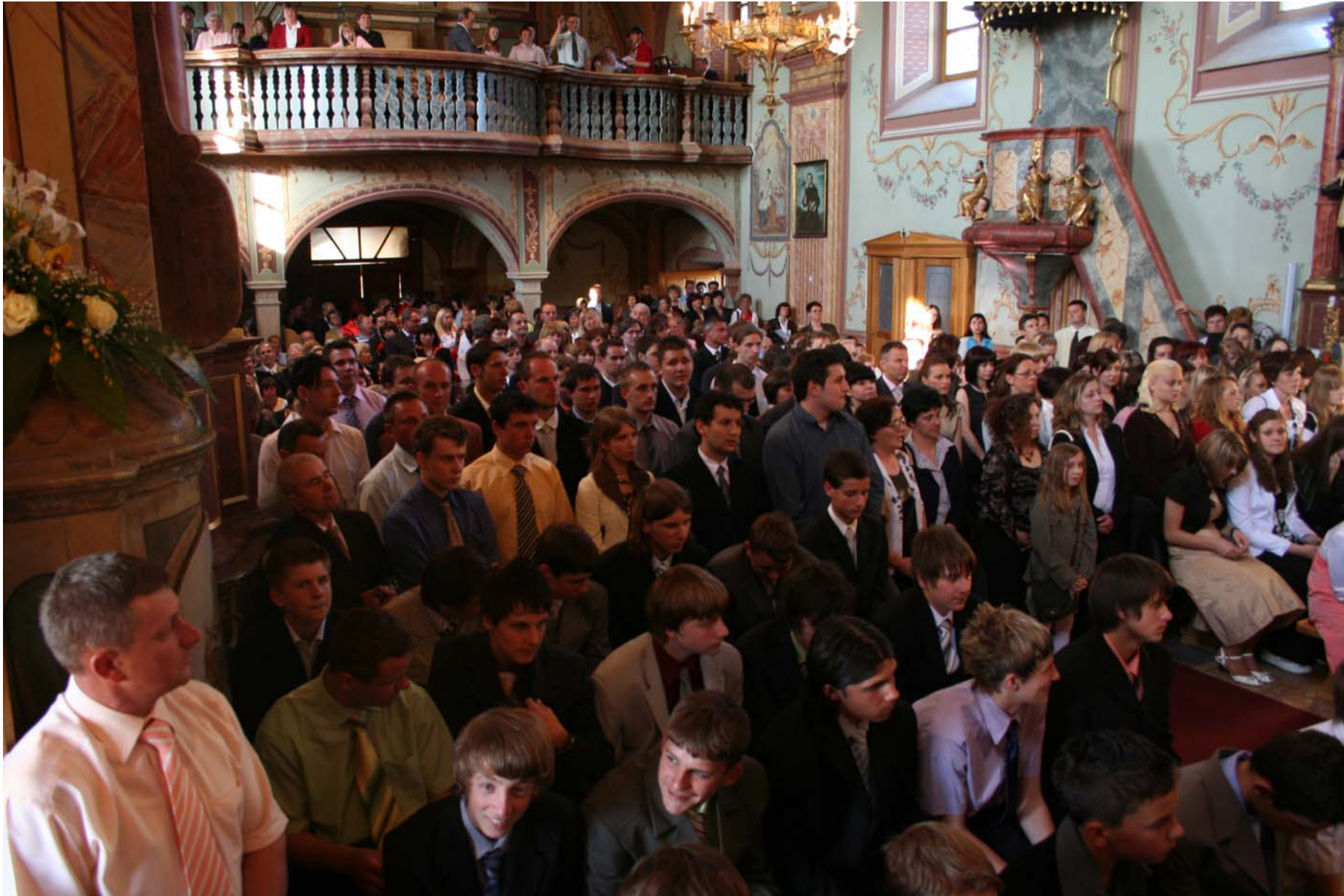
Sv. Misa prije nekoliko dana (sakrament Sv. Potvde)