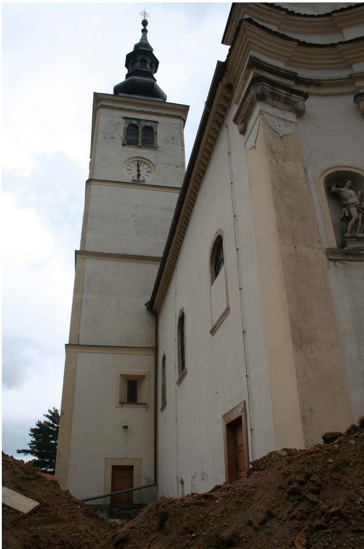
toranj crkve neposredno prije urušavanja