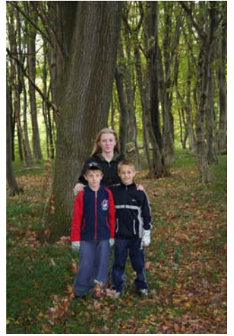
... a ovako poslije