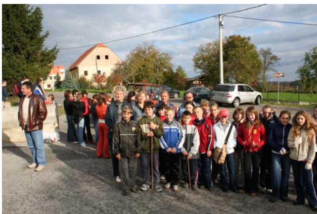
... i spremni smo za početak akcije!