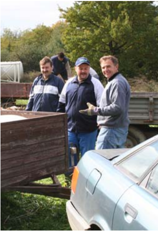
... sa terena ...