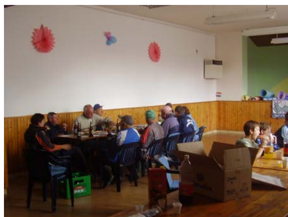
Na kraju akcije smo malo gricnuli...