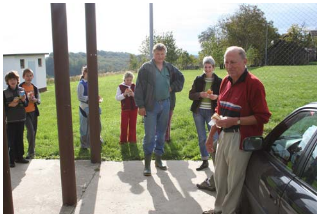
Školski ekonom je bio neumoran kao i uvijek ...