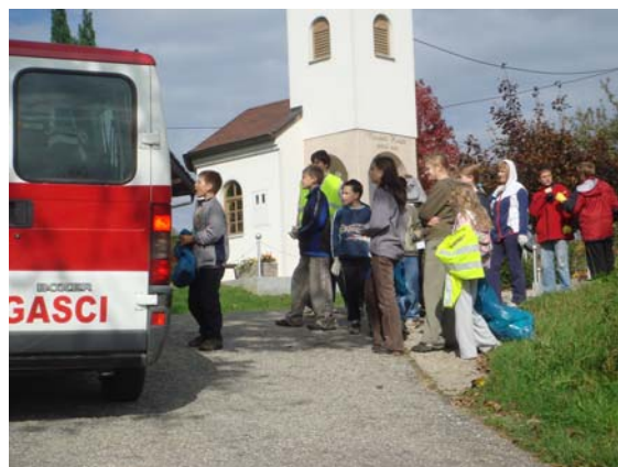
... vatrogasci su sa kombi vozilima bili na raspolaganju ...