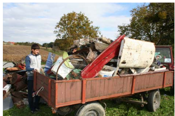
... čekalo se u redu za istovar otpada.