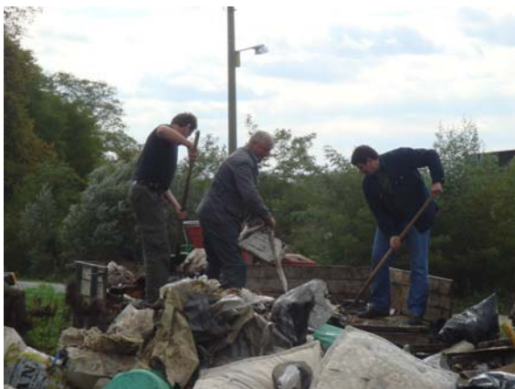
... a nakon istovara, hrpa prikupljenog otpada ...