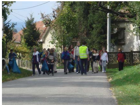
... a ekipe su bile po cijeloj Općini ...