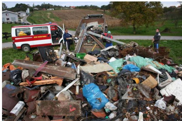
... se stalno povećavala ...