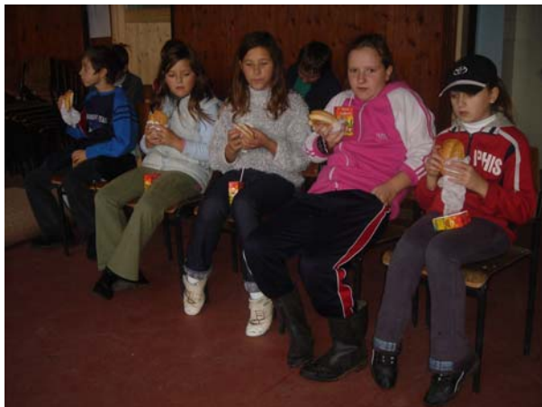
Odmor za užinu je pošteno zaslužen ...