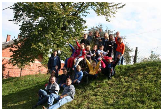
Vrijeme i raspoloženje je bilo odlično!