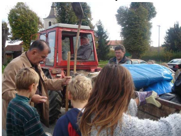
Savjet iskusnih ekologa treba pažljivo saslušati ...