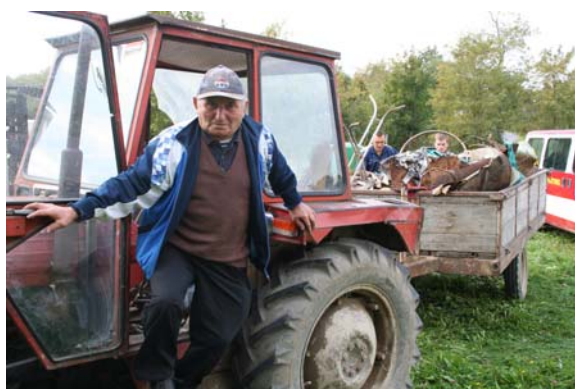
Bilo nas je mladih i starijih ...