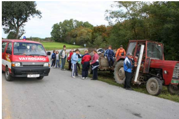
Trebalo je pokazati na kojoj strani su ekipe na terenu, ...