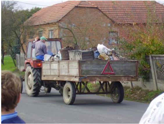
Na sabirno mjesto pristizale su nove količine otpada ...