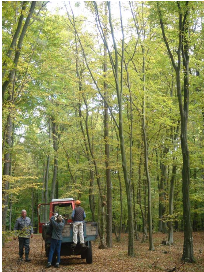
Nakon provedene akcije ...