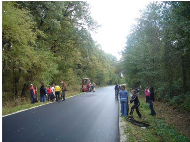
... uz cestu ...