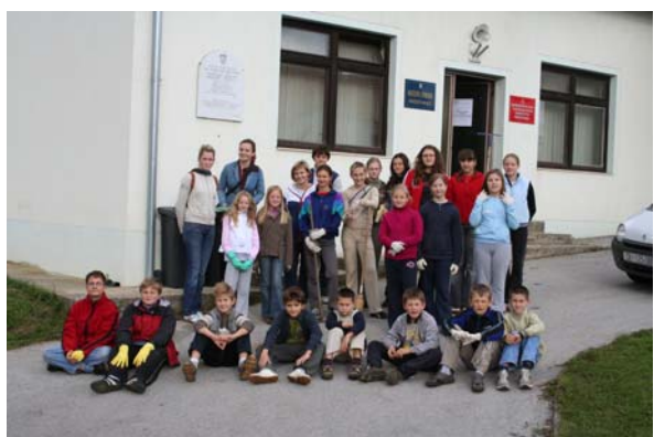
Na drugom kraju pak se uređivao okoliš Doma kulture.