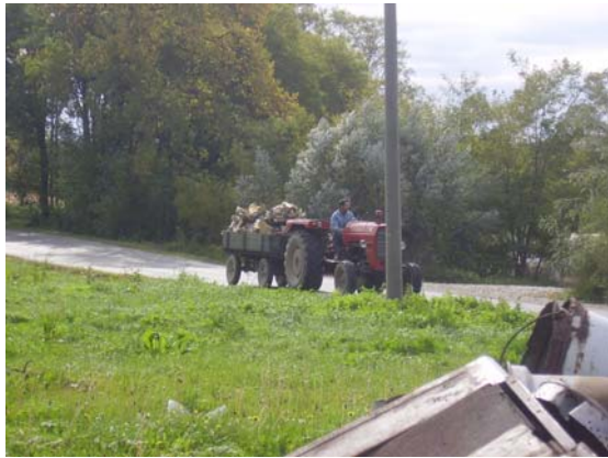
... sa svih strana ...