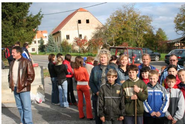
Još malo čekamo okupljanje ...