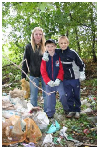
ovako je bilo prije ...