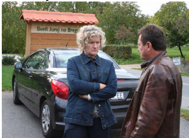
... Načelnica i zamjenik Načelnice