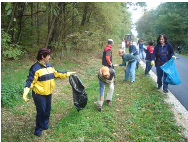
Ovako smo započeli ...