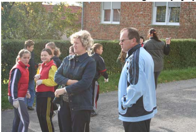
Načelnica Općine i Predsjednik Općinskog vijeća ...