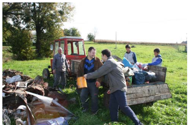
... a na sabirnom mjestu bilo je radno, ...