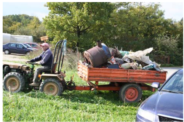
Stižu prve količine prikupljenog otpada ...